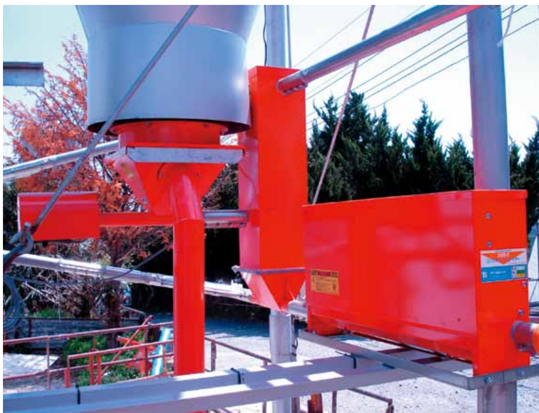
▲RC-50 Type mini + サイクルコンベヤー